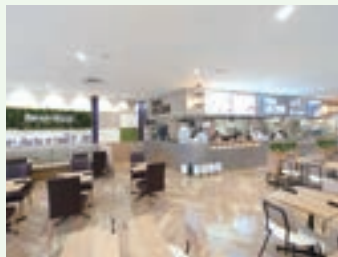
フードコートにオープンした「FOODLAB.358」

アル・プラザ彦根は、1979年に「アル・プラザ」の1号店として、JR彦根駅西口前にオープンして以来、多くのお客様にご来店いただきました。開店から40年を経てリニューアルを進め、2021年12月に第一期として6階建ての施設のうち地下1階から3階の食品フロアや暮らしのフロア、ファッションフロアをリフレッシュオープンしました。さらに2022年12月には第二期として、4階から6階の地域交流のフロアや、書店と展望カフェのフロア、屋上デッキが生まれ変わり、全館リニューアルしました。