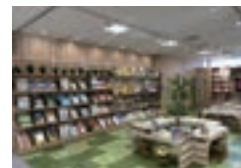
お子様向けのフリースペース

お子様向けのフリースペースや、眺望のよい窓側に設けたパーソナルスペースなど、本を読んだり自習をしたり、思い思いのスタイルで過ごしていただける空間を提供しています。