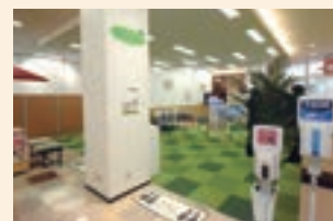
アル・プラザ武生(福井県越前市)に設置された「地域サロン おとな・Re」

「地域サロン おとな・Re」を通じて地域や地域住民の課題への理解を深め、より地域に密着した取組みを進めていくことを目指します。