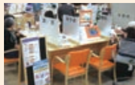
健康測定コーナー

高齢者世帯が多い地域にあるアル・プラザ武生では、店舗の改装に合わせ「地域サロン おとな・Re」をオープンしました。日々の健康状態をチェックできる「健康測定コーナー」や、卓球、囲碁、将棋などの趣味を通じて多世代交流ができる