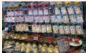
手作りフルーツサンドを中心とした 青果売場のスイーツコーナー

草津市は1968年に平和堂2号店である「くさつ平和堂」がオープンしたゆかりの地です。この地ならではの魅力を発信し、地域の皆様とともに成長してまいります。