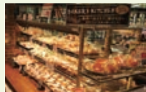
ペーカーリーコーナー