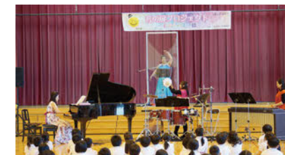
音の扉プロジェクト 学校訪問コンサート