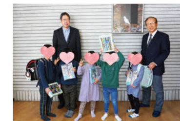
ランドセル・文具セット等を贈呈

滋賀県内の児童養護施設入所児童への支援をしています。新入学予定児童(小学1年生) 14名 へランドセル・文具セット・ギフト券を贈呈しました。また、施設を退所する18歳以上の 11名 へ自動車運転免許取得費用(最大30万円)を助成し、退所後の生活を支援しました。