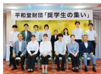
「奨学生の集い」には大学進学者奨学生の1回生と4回生に卒業OBを加えて開催しました

2022年度は、通常の年間給付額に加えて、2021年度に引き続き、新型コロナウイルス感染拡大に伴う臨時育英奨学金として、 大学生15万円、高校生5万円 を給付し、コロナ禍での各奨学生を支援しました。また、高校在学学生育英奨学生の新規募集を昨年18名から30名に大幅に増員しました。