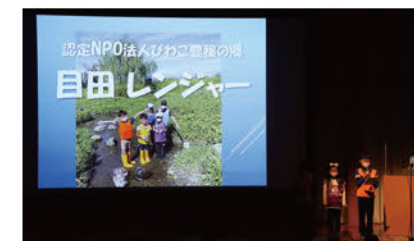
大賞を受賞した「びわこ豊穡の郷・目田レンジャー」

淡海こどもエコクラブに登録活動している各団体の活動交流会を開催し、その内容に応じた活動助成をしています。2022年度は淡海こどもエコクラブ活動交流会に 8団体 が活動発表を行い、各団体へ 助成金を授与 しました。大賞受賞団体の2023年3月、東京での全国大会へ出場するための助成も行いました。