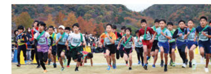
びわ湖駅伝スポーツフェスティバル小学生クラス

滋賀県および滋賀県スポーツ協会が主催する「びわ湖駅伝スポーツフェスティバル2022」の小学生クラスを中心に助成しており、県民がスポーツに親しみ、楽しむことにより「健康でいきいきとした滋賀」の構築を支援しています。