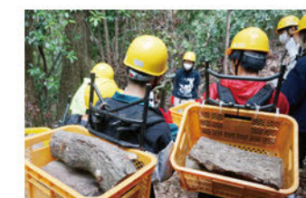
みどりの会伏見桃山 森林保全活動