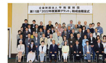
第11回「2022年度夏原グラント」助成金贈呈式

第11回「2022年度夏原グラント」助成金贈呈式で 61団体へ合計1,750万円を助成 しました。これまでの 11年間で延べ551団体へ累計1億5,632万円を助成 しています。