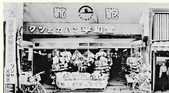
彦根市銀座街に「靴とカバンの店・平和堂」を創業