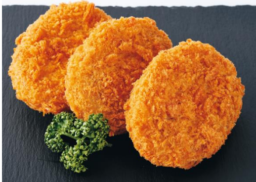
「 近江牛コロッケ 」