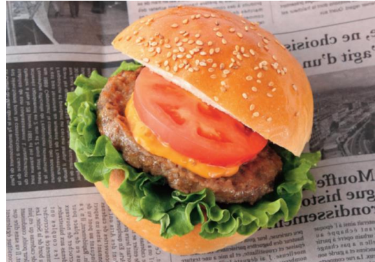
「 THE ビーフバーガー 」