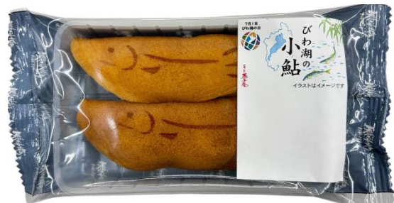
「 びわこの小鮎もち 」