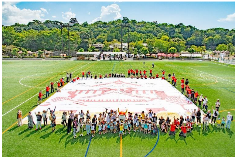
<彦根商工会議所青年部主催：彦根城世界遺産フェスタ2023>

彦根市による彦根城の世界遺産への登録の取り組みは、1992年度から始まり、現在はユネスコ（国際連合教育科学文化機関）の諮問機関であるイコモスが事前評価を行っている段階です。今後、推薦書の提出や諮問機関による調査等を経て、2027年度での世界遺産への登録を目指しています。