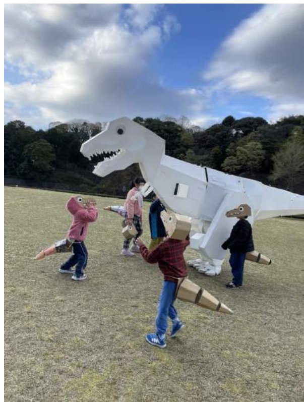
<子供たちが手作りしたミニ恐竜と「うちのシロ」>

夏休みに開催するこのイベントは、参加者を募集中です。アル・プラザ鯖江にぜひ、お越しください。