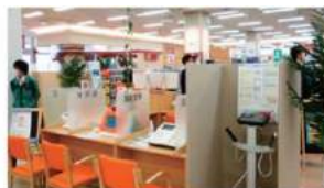
健康測定コーナー