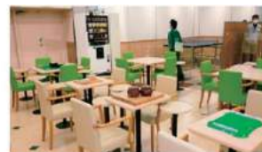
囲碁将棋コーナー

を開設しました。お客様がお買い物以外の目的で来店し、卓球や囲碁将棋などのコンテンツを通じて、世代の異なる学生とシニアの方々とのつながりや交流も生まれ始めており、おかげさまで1,500名以上の会員様にご利用・ご登録いただいております。