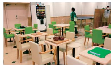
囲碁将棋コーナー