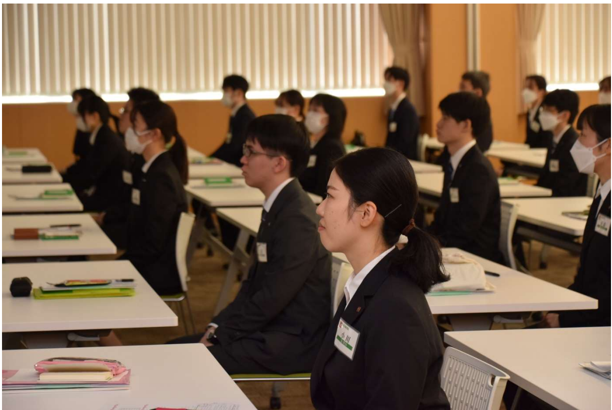
これまでの緊張がほぐれ新たな気持ちでスタートします