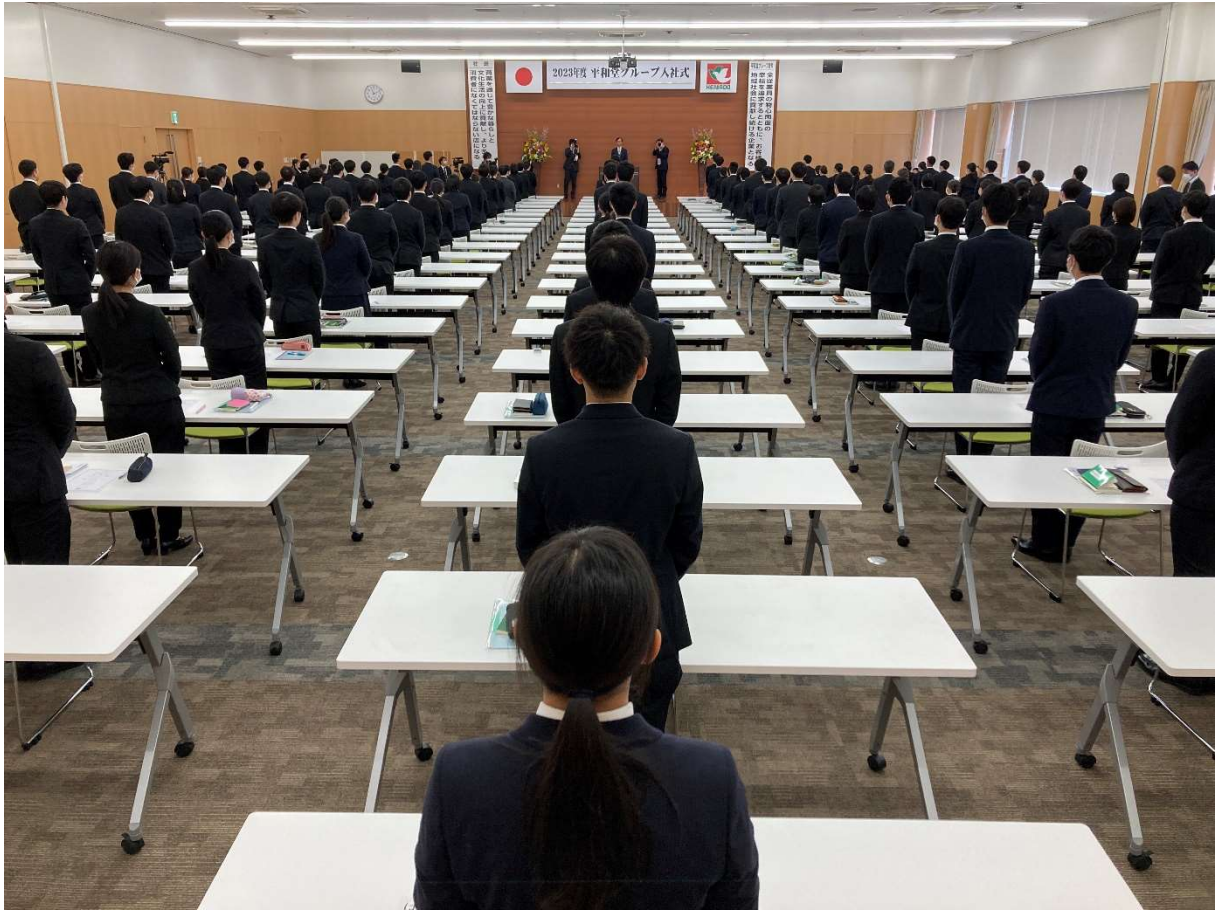
緊張の中、いよいよ平和堂グループ入社式が開始