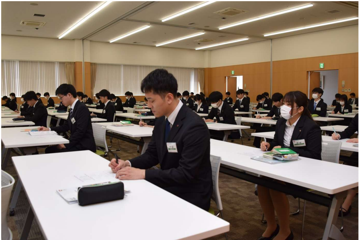
マスクの着用を自由とした今回の入社式では、約半数がノーマスクで参加しました