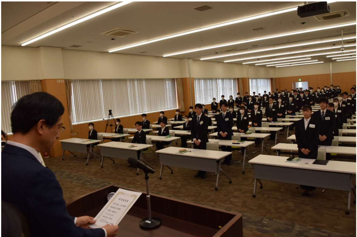
会社ごとに社員認定宣言