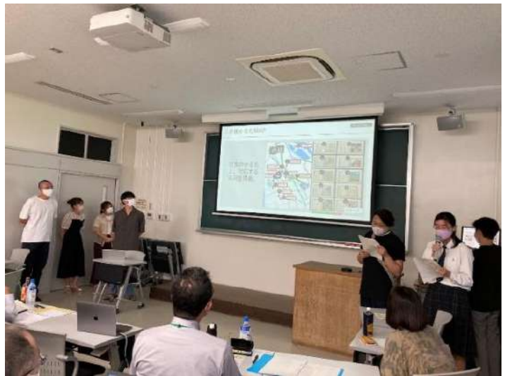
＜滋賀大学夏季集中講義の様子＞

（参考資料）国立大学法人滋賀大学と株式会社平和堂、麒麟ビール株式会社、株式会社ブリヂストンとの連携に関する協定書」締結式 概要 https://www.heiwado.jp/news/2021/0517_hikone.html