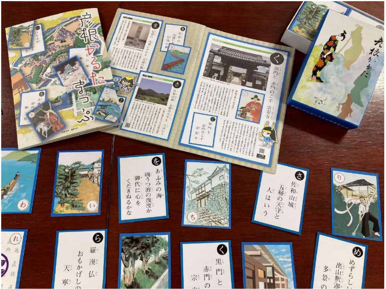
<「彦根かるたまっぷ」と「彦根かるた」>