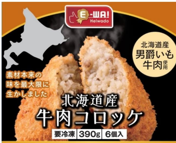
E-WA! 北海道産牛肉コロッケ