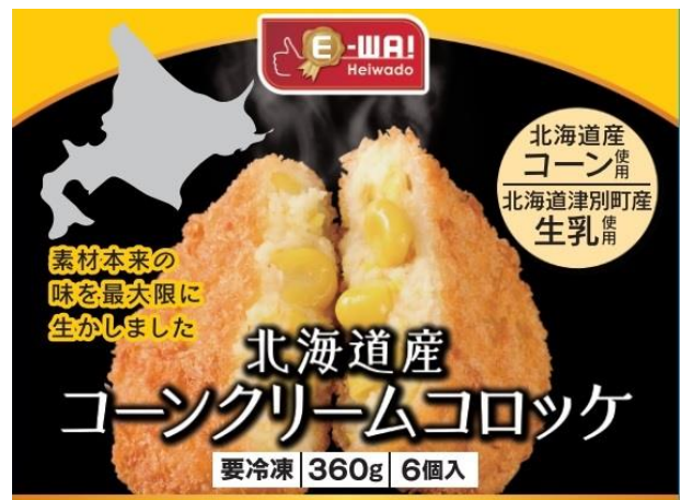
E-WA! 北海道産コーンクリームコロッケ