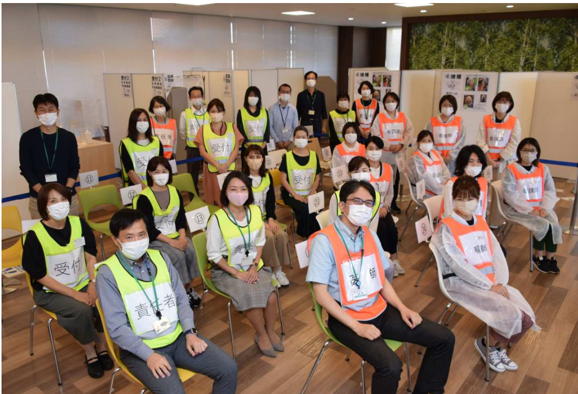
<ワクチン接種推進チームの皆さん>

ただ、ワクチン接種をしても感染する可能性は残っていますので、基本的な感染予防対策の徹底を継続して、来るべき第6波に備えていきます。」