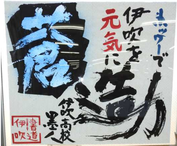
伊吹高校書道部の皆さんの応援メッセージ。