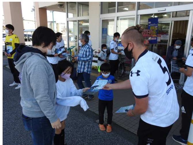
店頭でのPR活動やサポーター募集活動。