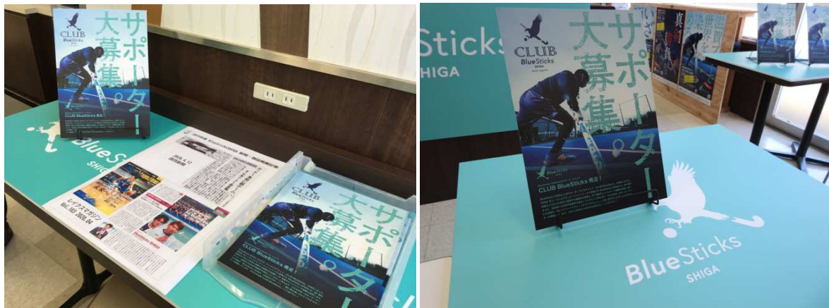
大型パネルやチームポスター、選手パネルなど臨場感のある写真でホッケーの迫力と魅力をPR。