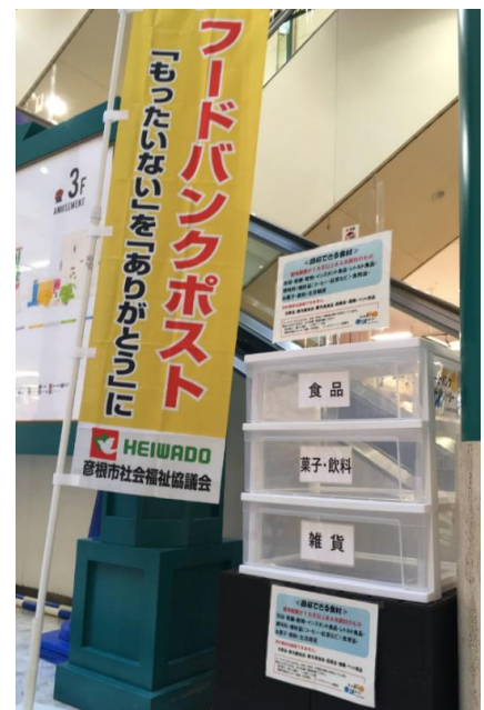
<ビバシティ彦根に設置の フードバンクポスト>