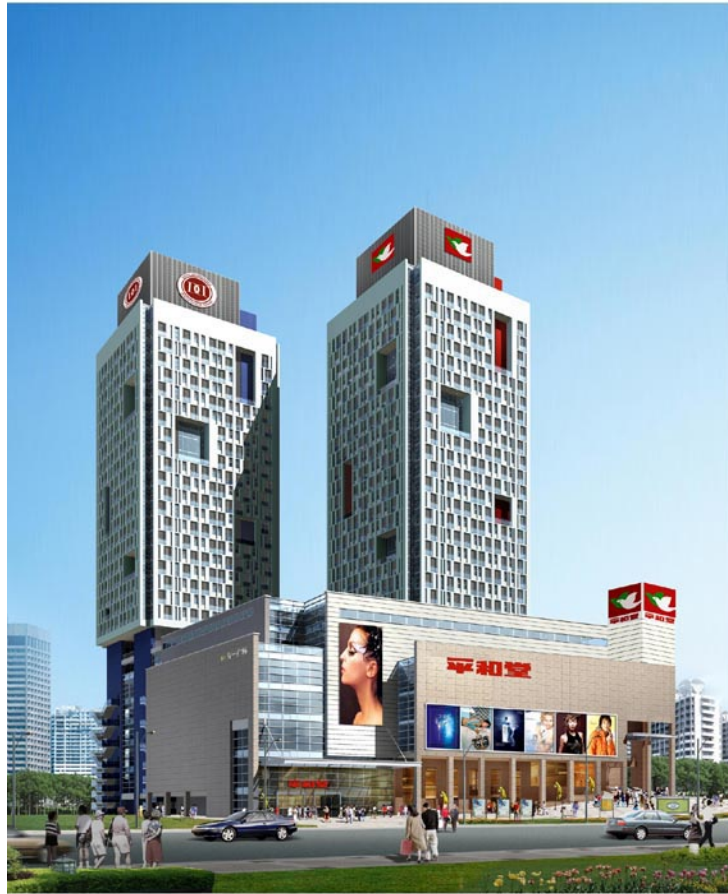
东一国际商业广场